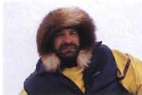
LONNIE DUPRE ESTADOS UNIDOS

UBICACIÓN DEL PROYECTO Khomiin Tal, Mongolia occidental